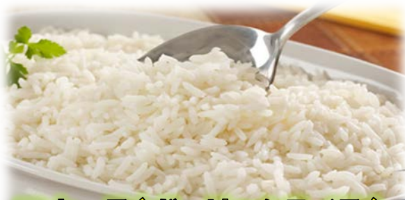
アホース(ガーリックライス)