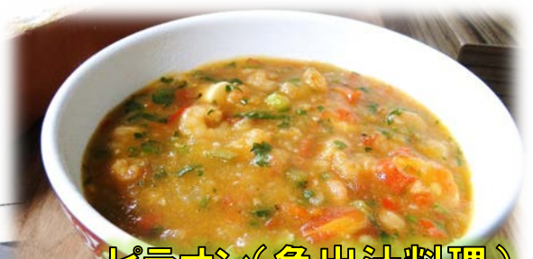
ピラオン(魚出汁料理)